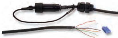
C95-10, -20, 30LN Системные кабели

Системные кабельные сборки обеспечивают соединение между мастер-станцией U9500 и кабелями поясной станции пользователя. Имеются готовые кабели длиной 10, 20 и 30 футов (3,4 м, 6,8 м и 10,2 м) с разъемами, снабженными ключом, смонтированными на одном конце, для соединения с поясными станциями и гарнитурами.